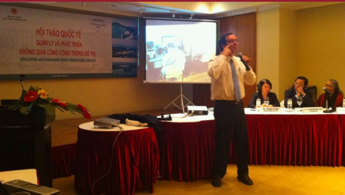
Ông Gil Penalosa - giám đốc điều hành của Tổ chức "8-80 Cities" - trình bày tại hội thảo.